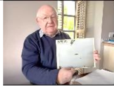
هَذَا هُوَ الصُّحْفِيُّ الْبَرِيطَانِي "دِيفِيدُ كَلَارِك"، وَبِجَانِبِهِ الْمَسْؤُولَ الصُّحْفِيِّ السَّابِقِ بِالْقُوَّاتِ الْجَوِّيَّةِ الْمَلِكِيَّةِ